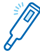
出勤前の検温と記録