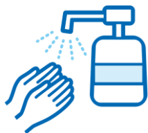
アルコール消毒液の配置