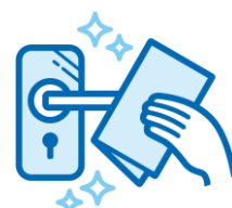
共用部や機材の消毒