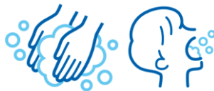
勤務時手洗い等の徹底